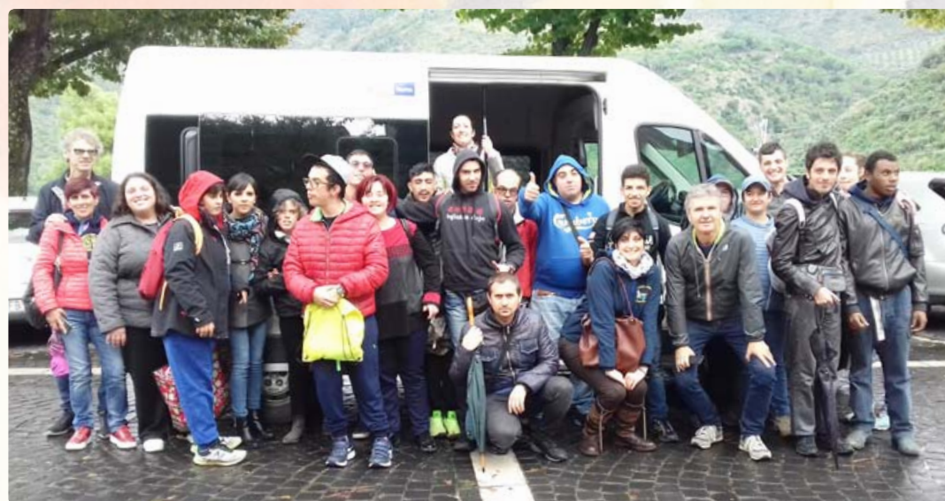
Il materiale fotografico di questa pubblicazione è stato messo gentilmente a disposizione dai soci e dai volontari dell'associazione. Un ringraziamento particolare a Samanta Sollima per la preziosa collaborazione.